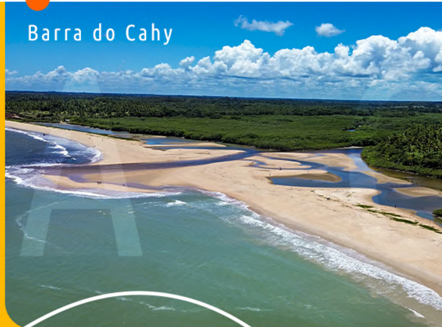
Barra do Cahy

Paisagens que o mundo inteiro busca, bem diante de você.